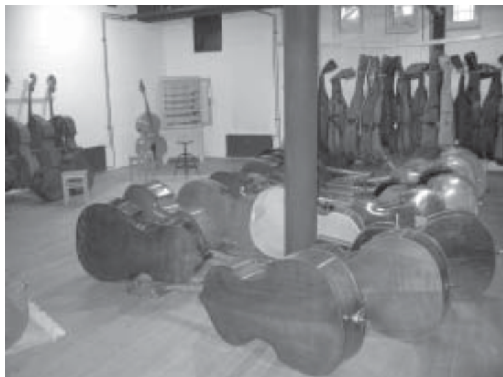
WOB Hampuri: alakerran showroom