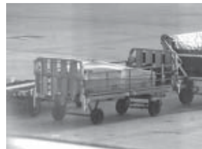
Lastaaja ehätti karata.

Hampurissa Finnairin yhteistyökumppanin virkaintoinen nuori lähtöselvitysvirkailijatar otti tilanteesta kaiken ilon irti: laatikko piti toisen virkailijan todistaessa käydä punnitsemassa, paikalle hälytetty lastauspäällikkö kävi kertomassa että se ei välttämättä mahdu kyytiin. Tietysti veloitettiin myös ylipainomaksu. Onneksi olin paikalla hyvissä ajoin, että tiskillä ei ollut jonoa, joten saatoin suhtautua kyykytykseen huumorilla, tosin pinna oli lopullisesti katketa kun näin lastaajan istuvan laatikon kannen päällä. Onneksi Kolstein-kotelo on vahvaa tekoa eikä vaurioita tällä kertaa syntynyt.