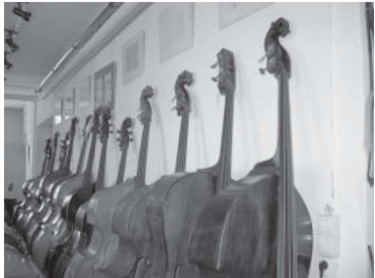
World of Basses, Reutlingen, Saksa. Täältä taitaa löytyä soitinmelkein joka lähtöön!

Jatkoin testaamista vielä koko seuraavan päivän. Käytin testibiiseinä mm. Otellon sooloa, Mahlerin 2. sinfonian ensiosaa, Sibeliuksen 1. sinfoniaa, Bottesinin konserton kadenssia, Wagnerin Siegfriedin 3. näytöksen alkusoittoa, Sibeliuksen Kullervon sotaanlähtö-