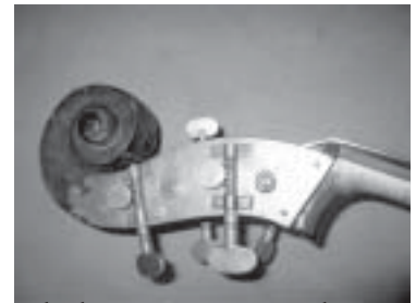
A-kielen viritysruuvi on yläpuolella, muuten kielten järjestys on tavanomainen.

Mikäli on yksin liikkeellä on paras neuvo kysyä apua business-puolen lähtöselvityksestä, neuvonnasta tai Ilmailulaitoksen oppailta.”