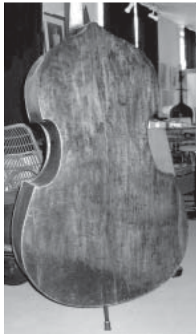
Seitz takaa. Basso on joskus pelastettu tulipalosta, pohjan lakka on alhaalta mustunut.