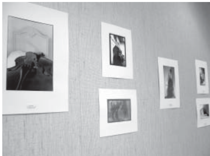
Näytteillä oli myös Liisa Kotilan taidevalokuvia ja -grafiikkaa.