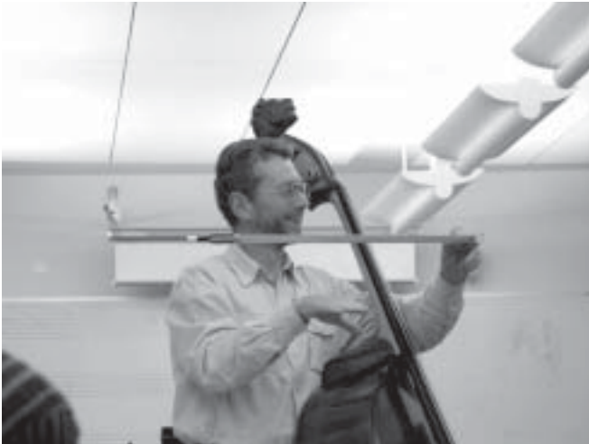
Uusi, suora jousiote vai esitelmä aiheesta ”rhythmic direction”?