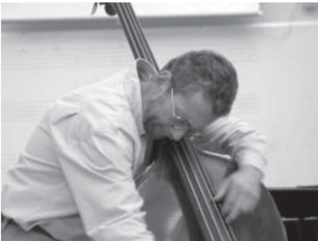
“I’m challenging you!”